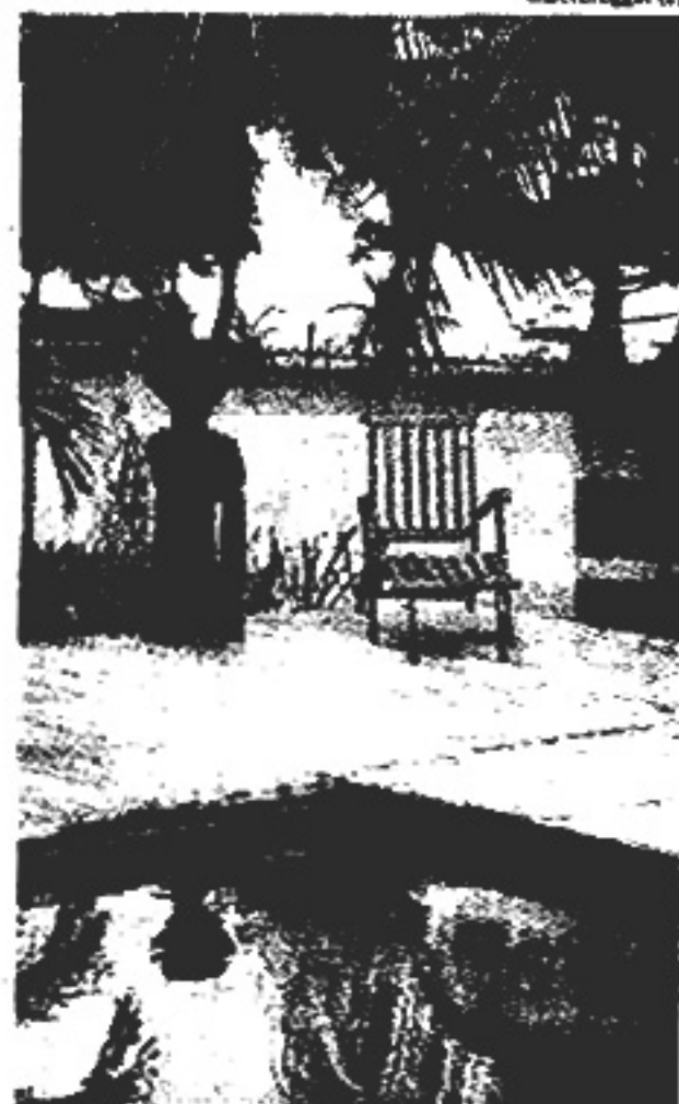
Naturmaterialien in ruhiger Umgebung: Ananyana Resort auf Panglao Island